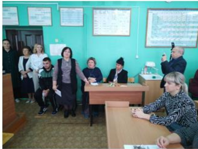
Подведение итогов семинара

В 2023-2024 учебном году 20 педагогов прошли курсовую подготовку по направлению «Формирование функциональной грамотности у школьников».