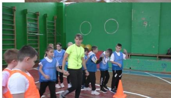
Урок физической культуры